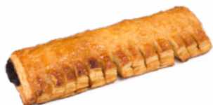
HERRADURA DE CHOCOLATE 170 GRs. 09018122