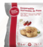
EMPANADILLA HORNEABLE PIZZA 4x1 CONGELADA 03108064