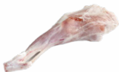
PIERNAS CORDERO LECHAL CONGELADAS 05054941