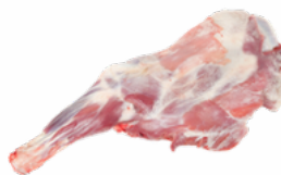
PALETA CORDERO LECHAL CONGELADA 05055086