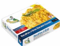
BACALAO DORADO B/300 GRS. CONGELADO 03101178