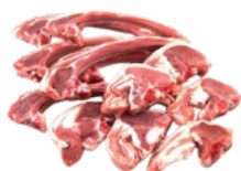
CHULETAS CABRITO 5x1 KGS. CONGELADAS 05058138