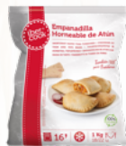
EMPANADILLA HORNEABLE ATUN 4x1 CONGELADA 031008024