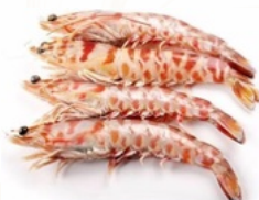
LANGOSTINO MEDITERRANEO TIGRE COCIDOS 3 B/500GR 03108271