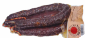
CHORIZO VENADO MRO 07051833