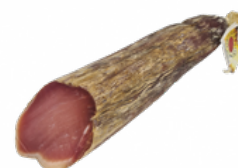
LOMO IBERICO CEBO MRO 07051394