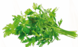
PEREJIL 5x1 CONGELADO 10051631