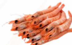
GAMBA BLANCA COCIDA 60/80 CAJA 600 GRS 02101165