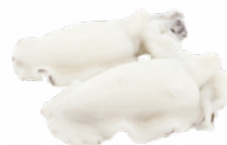
SEPIA IQF 500/1000 C/7 KGS. CONCISA CONGELADA 02051144