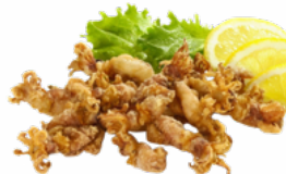
PUNTILLITAS ENHARINADAS CONGELADAS 03155339