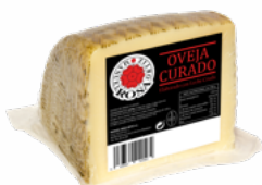
QUESO OVEJA 1/4 LECHE CRUDA M.R.O. 08051469