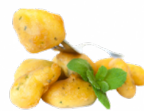
SEPIA REBOZADA 4x1 LOW FROST CONG. 03101102