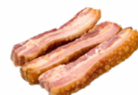
TORREZNOS PREFITOS 2x1,5 KGS. REF. 04158069