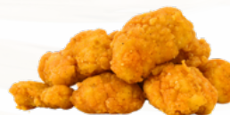
NUBES DE POLLO 8x500 CLACOR CONGELADAS 03011774