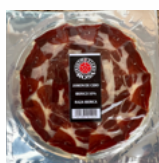
JAMON CEBO IBÉRICO 50% RAZA IB. 100GRS 07151332