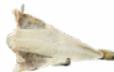
BACALAO CURADO 40/60 PESCAFINA 02011501