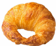
CROISSANTS MARGARINA FERM 120 GRs. 09018119