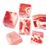
COCHIFRITO TROCEADO CONGELADO 04011700