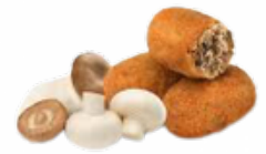
CROQ. BOLETUS 10x500 CONGELADAS 03158030