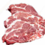
CHULETAS CERDO AGUJA C/5 KGS. CONGELADAS 04011292