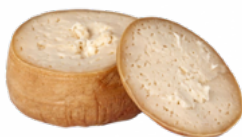
QUESO TORTA UNTAR TRADICIONAL 08051458