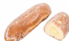
PEPITO CREMA AZUCARADO 110 GRs. 09018126