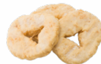
RODAJAS MZA. REBOZADAS B/1 KGS. CONGELADAS 03151140