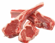
CHULETAS CORDEROS MRO CONGELADAS 05051325