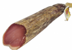
LOMO CRUZADO CASERO MRO 07051834