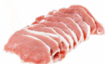
LOMOS CERDO FILETEADOS COOPECARN 5 KGS. CONGELADO 04015406