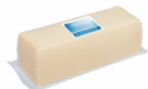
QUESO BARRA SEMICURADO M.R.O. 08051462