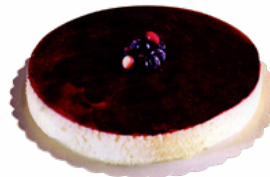
TARTA QUESO ARANDANOS CON BASE DE GALLETA 09101804