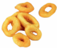
CAPRICHOS DE CALAMAR C/4 KGS. CONGELADOS 03101569