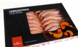
LANGOSTINOS COCIDOS 3 E 5X1 KG. CONG 02101150