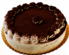
TARTA TIRAMISU 10/12 RACIONES 09101803