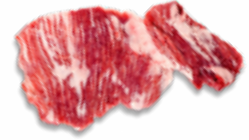
SECRETO IBERICO EXTRA CONGELADO 04101286