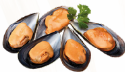
MEJILLON PASTEURIZADO 30/40 B/1 KGS. CONGELADO 02251197