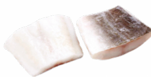
BACALAO SUPREMA MSC 200/300 IQF 7 KGS. CONG. 02011494