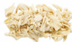
MIGAS BACALAO 8x500 GRS. ELBA CONGELADAS 02018008