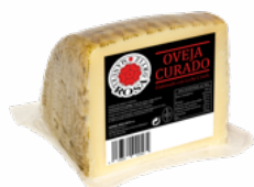
QUESO OVEJA 1/2 LECHE CRUDA M.R.O. 08051450