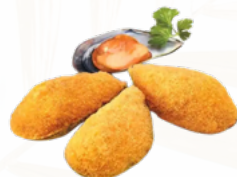
MEJILLON TIGRE 6x1 CLACR CONGELADO 02151772