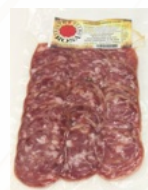
SALCHICHON IBERICO 150 GRs. CULAR 07058169