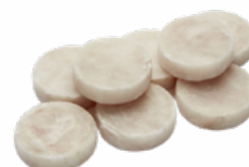
MEDALLONES DE MERLUZA 4X1KG 03108273