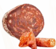
MORCON CHORIZO MRO 07051837