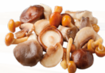
SURTIDO DE SETAS CON BOLETUS 4x1 KG. CONGELADO 10055659