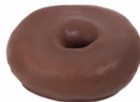
MAXI HOOPS BOMBON 80 GRs. 09018123