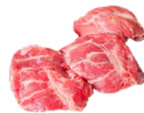
CARRILLADA CERDO B/1 KG. ALEMANIA CONGELADA 04011221