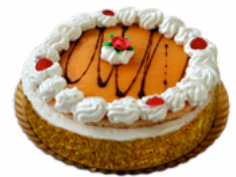
TARTA WHISKY 10/12 RACIONES 09101805