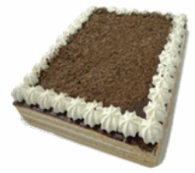
PLANCHA SELVA NEGRA 28 PORCIONES 09101815