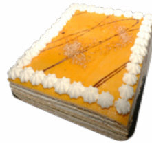
PLANCHA SAN MARCOS 28 PORCIONES 09101810