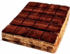
PLANCHA TIRAMISU 28 PORCIONES 09101811