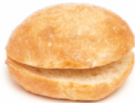
RUSTIC CRISTAL BURGUER 12 CM DYL 110 GRs. 09058110