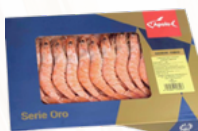
LANGOSTINOS COC 2 E 5x1 KG. CONGELADOS 02101157