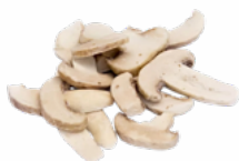
CHAMPIÑÓN LAMINADO B/2,5 KGS. CONGELADO 10051621