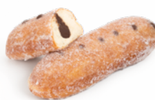
PEPITO CHOCO AZUCARADO 110 GRs. 09018125