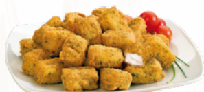
BACALAO REBOZADO 6X1KG CONGELADO 03101491