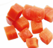
ZANAHORIAS DADO 4x2.5 KGS. CONGELADAS 10051649