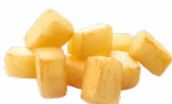
PATATAS PREF. BRAVAS B/2,5 KGS. CONGELADAS 10011504