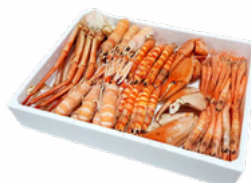
MARISCADA COC EXTRA 5x800GRS CONG 0210698