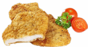
PECHUGA EMPANADA C/4KG CLAVO IWP CONG. 03011784