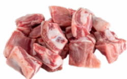
CALDERETA CORDERO LECHAL CONGELADA 05055080