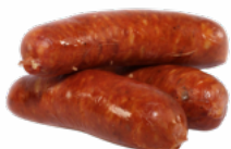
CHORIZO CASERO EXTRA ILLAS CONGELADO 04151409