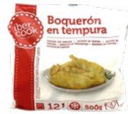
BOQUERONES TEMPURA 10x500 CONGELADOS 03101170