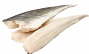
FILETES BACALAO +1000 GRS CONGELADOS 02011595