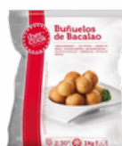
BUÑUELOS BACALAO 4x1 IBERCOOK 03101729