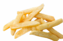
PATATAS PREF. CASERA B/2,5 KG. 9x18 CONGELADAS 10011548