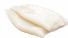
TUBO DE POTA 22/27 NEW CONCISA C/5 KGS. CONG. 02051580