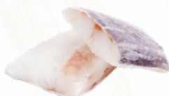
VENTRESCAS BACALAO IQF 1x5 KGS. CONGELADAS 02015850