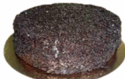
TARTA MUERTE POR CHOCOLATE 09101813