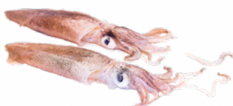
CALAMAR ENVUELTO 12/16 MARRUECOS CONGELADO 02051771