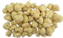
COLIFLOR REBOZADA B/1 KG. C/6 KGS. CONGELADA 02151218