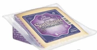
QUESO SIN LAC. CUÑAS PRECORTADAS SAN V. 08051468