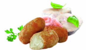
CROQ. MERLUZA GAMBAS 10x500 GRS. CONGELADAS 03108035