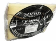
QUESO OVEJA LECHE CRUDA CUÑA LAS TOBOSAS 08058180