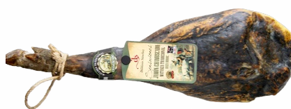
JAMON KONDUROC SENSACIONES +24 MESES 07151342