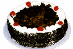
TARTA SELVA NEGRA 10/12 RACIONES 09101802