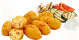
CROQ. VERDURA Y QUESO CABRA 10x500 CONGELADAS 03158037