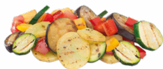
PARRILLADA CAMPESTRE 5x1 KG. CONGELADA 10055684