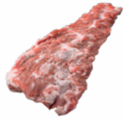
PLUMA IBERICA CABEZADA CONGELADA 04108076