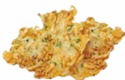
TORTILLA DE CAMARON 4 X 700 (48UDS) CONG 03155838