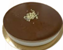
TARTA TRES CHOCOLATES 10/12 RACIONES 09101808