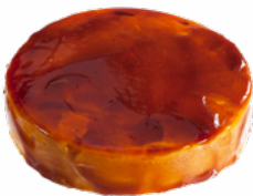
TARTA GALLETA CON CARAMELO 09101807