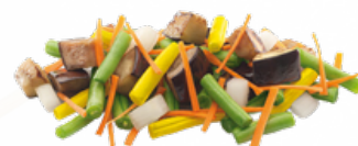
SALTEADO CAMPESTRE 5x1 KG. CONGELADO 10055682