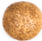
PAN HAMBURGUESA SIN GLUTEN DYL 80 GRs. 09058112