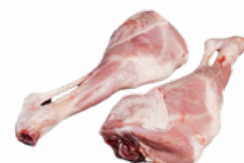
PALETAS CORDEROS NACIONAL CONGELADAS 05055032