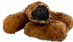
CROQ. CHIPIRON TINTA 10x500 GRS. CONGELADAS 03108036