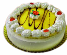
TARTA DE LIMÓN 10/12 RACIONES 09101801