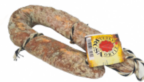
SALCHICHON IBERICO HERRADURA MRO 07051842