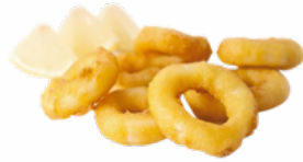
ANILLAS ROMANA 2x2,5 KGS. CLAVO CONGELADAS 03101765