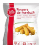
FINGUER DE MERLUZA IBERCOOK 4X1KG CONGELADO 03108026