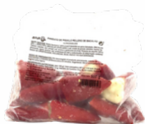
PIMIENTO PIQUILLO BACALAO C/5 KGS. CONGELADOS 03151565