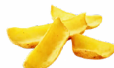
PATATAS PREF. DIPPERS TEJA 2,5 KGS. CONGELADAS 10011552