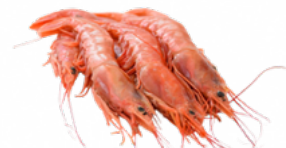
GAMBON N.2 ARGENTINA 6X2 KGS. CONG. 02101697