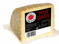
QUESO OVEJA LECHE CRUDA CUÑA 200 GRs. 08051461