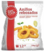
ANILLAS REBOZADAS 4x1 IBERCOK CONGELADAS 03101172