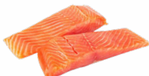
LOMOS DE SALMON 12x250 GRS. CONGELADOS 02021696