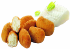
CROQ. BRANDADA BACALAO 10x500 CONGELADA 03108031