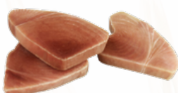
SOLOMILLO ATUN 12 UDS. 225 GRS. CONGELADO 02201146