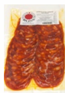
CHORIZO IBERICO 150 GRs. CULAR 07058167