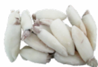
CALAMAR LIMPIO IQF 10/20 6x1 KG. CONGELADO 02051134