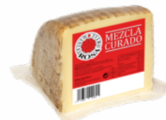
QUESO MEZCLA CURADO MEDIO M.R.O. 08051448