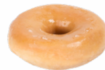
MAXI HOOPS GLASEADOS 70 GRs. 09018124