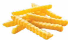
PATATAS PREF. RIZADAS B/2,5 KGS. CONGELADAS 10011611