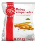
RABAS EMPANADAS IBERCOOK 5x1 CONGELADAS 03101539