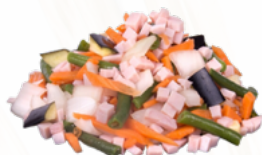
SALTEADO DE PAVO 5x1 KG. CONGELADO 10055654