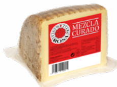
QUESO MEZCLA CURADO CUARTOS M.R.O. 08051470