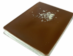
PLANCHA TRES CHOCOLATES 28 PORCIONES 09101812