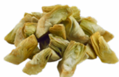
ALCACHOFAS TROCEADAS 4x2.5 KGS. CONGELADAS 10051635