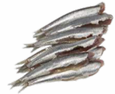
BOQUERONES IQF G C/6 KGS. CONGELADOS 02201176