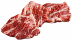
ABANICO CERDO IBERICO CONGELADO 04101389