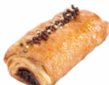
SUPER NAPOLITANA CHOCO FERM 135 GRs. 09018121